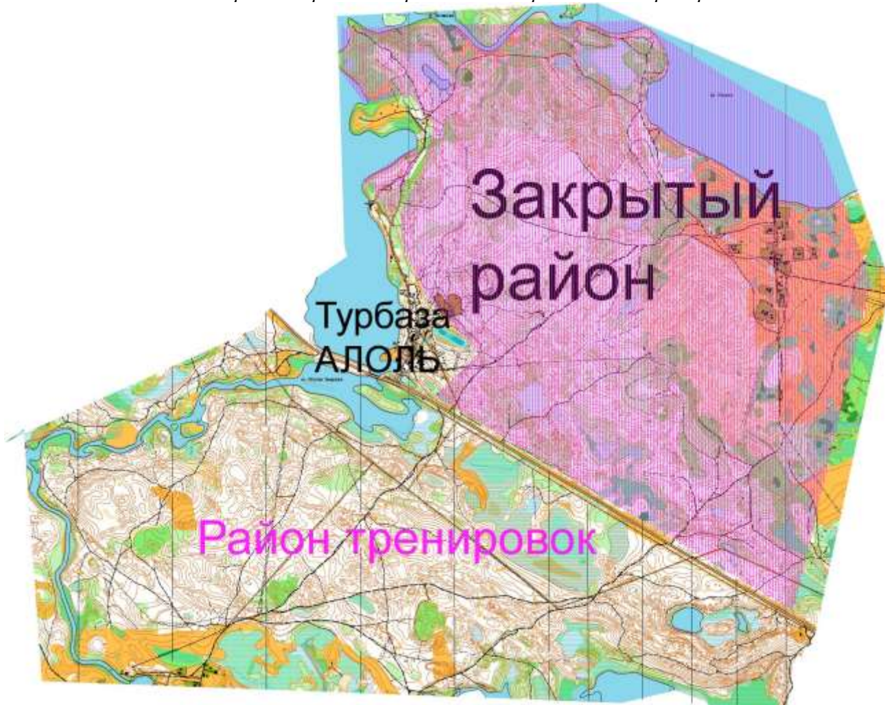
Схема закрытого района соревнований и района для тренировок.

Район тренировок открыт с 1 апреля по 7 июня 2026 года. В закрытый район соревнований выход запрещен. Запрещается передвижение по турбазе Алоль с любыми карт материалами и схемами.